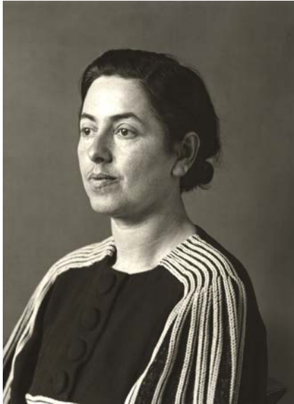
August Sander, Verfolgte , c. 1938. Gelatinesilberabzug, hergestellt von Gerhard Sander, 1990. © Die Photographische Sammlung / SK Stiftung Kultur - August Sander Archiv, Köln; VG BildKunst, Bonn; ADAGP, Paris, 2018. Courtesy of Galerie Julian Sander, Köln and Hauser & Wirth, New York.