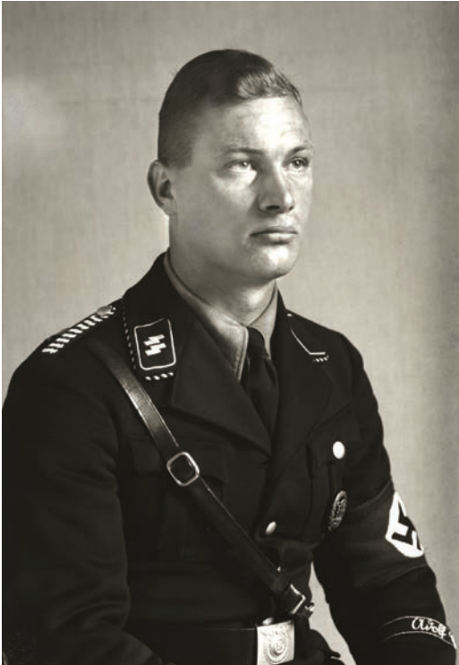
August Sander, Nationalsozialist , c. 1940. Gelatinesilberabzug, hergestellt von Gerhard Sander, 1990.

Die August Sander-Ausstellung umfasst 120 Portraits aus Sanders Werk «Menschen des 20. Jahrhunderts» und bisher unveröffentlichte Kontaktabzüge.