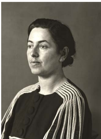
August Sander, Persecuted , c. 1938 Gelatin silver print, produced by Gerhard Sander, 1990. © Die Photographische Sammlung/SK Stiftung Kultur – August Sander Archiv, Cologne; VG Bild-Kunst, Bonn; ADAGP, Paris, 2018. Courtesy of Galerie Julian Sander, Cologne and Hauser & Wirth, New York.